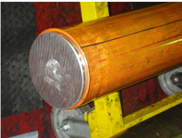
Überziehen der Kupferhülle über den Aluminiumkern